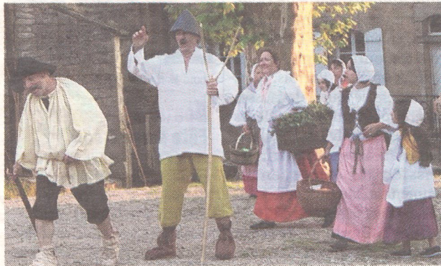
■ Les scènes mettent en valeur le patrimoine bâti de Château-Chalon.

Les acteurs jouent la vie d'autrefois du « Rocher », celle de ses manants et seigneurs, de ses comtes et cardinaux, de ses bourgeoises et moniales. D'un lieu à l'autre, entre places et belvédères, cours et jardins, le colporteur fait passer les spectateurs d'un siècle à l'autre, de Marie de Bourgogne à Charles Quint, des nobles dames que furent les abbesses aux misères de la